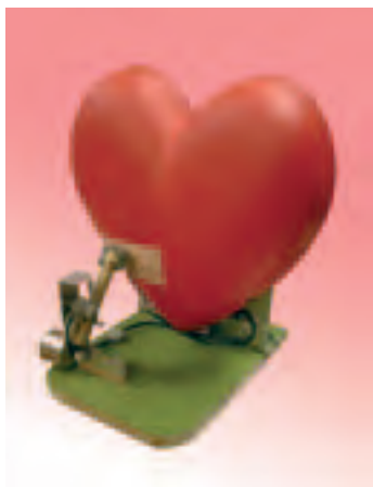
Paul Granjon, Machine à battement de cœur , 2006. © Paul Granjon.

Paul Granjon est artiste. Né à Lyon, il vit et travaille à Cardiff au Royaume-Uni. Il a participé à Eldorado , l'exposition inaugurale du Mudam en 2006, et à Mondes inventés, Mondes habités (Mudam 08.10.2011–15.01.2012).