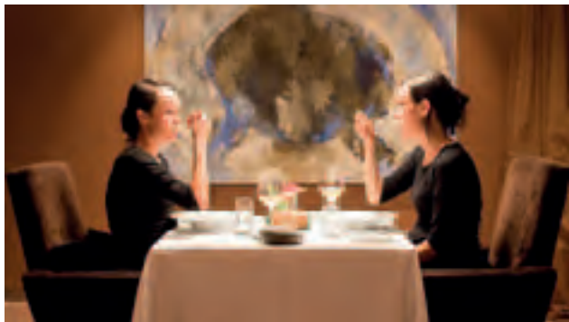
L.A. Raeven – Beyond the Image , 2010. Film still.

In perspective of the exhibition L.A. Raeven – Ideal Individuals at Casino Luxembourg – Forum d'art contemporain (28.01. – 22.04.2012).