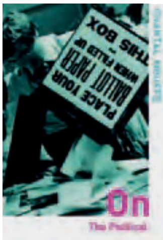
Couverture de l'ouvrage de Chantal Mouffe, On the Political (Routledge, Londres, 2005).

Chantal Mouffe est professeure de théorie politique et directrice du Center for the Study of Democracy à l'Université Westminster de Londres. Elle a enseigné dans de nombreuses universités en Europe, aux États-Unis et en Amérique latine et elle est membre correspondant du Collège International de Philosophie à Paris. Elle est l'auteure de nombreux ouvrages en anglais dont le plus récent est On The Political (Routledge, Londres, 2005).